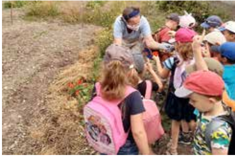
Au jardin, fleurs et lapins attendaient les enfants.

Cet été, la fédération des foyers clubs d'Alsace a adapté les accueils de loisirs sans hébergement aux mesures sanitaires. En choisissant des loisirs « de proximité », transports collectifs et files d'attente ont été évités. Une grande place a été donnée au faire soi-même pour un retour à l'animation simple et authentique.