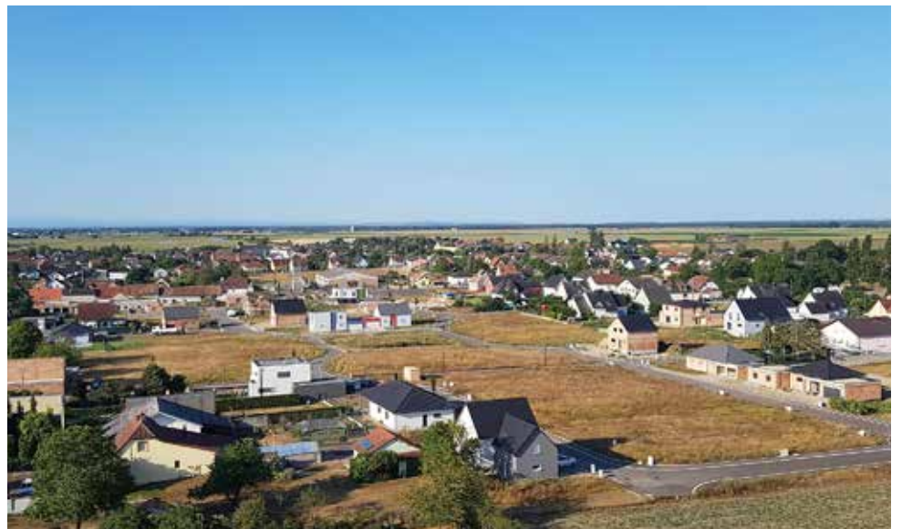
Du haut du château d'eau, l'avancée des travaux est bien visible.

Initiée par la commune en 2014, l'opération foncière menant à l'émergence d'un nouveau quartier au nord du village est en voie d'achèvement et les premiers habitants du Jardin des poètes ont emménagé. Les travaux de finition de la voirie et les aménagements (place centrale et espaces verts) sont prévus au 2 e semestre 2021.