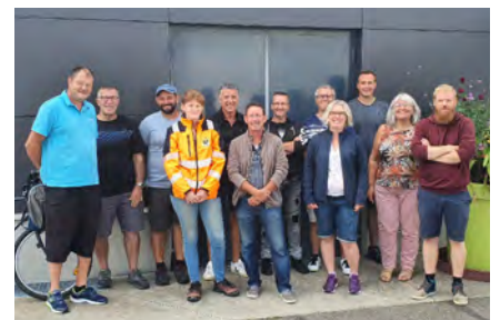
Le jury du concours de maisons fleuries 2022.