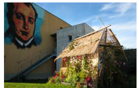
Décor d'inspiration antillaise à l'école Arc-en-ciel.