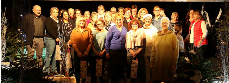
Prix de la commune pour les personnes qui ont cousu des masques durant la crise sanitaire.