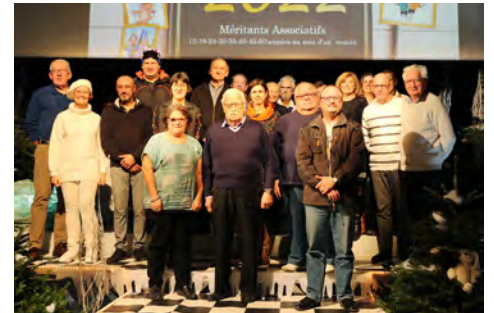
Les «méritants» 2021/2022.