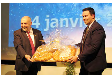
Clin d'oeil de Stephan Ostermaier, Bürgermeister de Hartheim am Rhein, au jumelage entre les deux communes.

celles et ceux qui aiment traverser le pont de la Hardt : les 30 ans du jumelage entre Hartheim et Fessenheim lors de la fête de l'amitié, les 25 ans du groupement de coopération transfrontalière qui prendront la forme d'une journée cycliste, la manifestation «La BiCyclette» et le 1250 e anniversaire de Hartheim. S'en est suivie une liste «à la Prévert» des dossiers et chantiers en cours ou à venir. La projection d'une nouvelle vidéo de présentation de Fessenheim a ponctué l'intervention du maire. Elle est visible sur le site de la commune (Présentation de la ville). Les gagnants et participants du concours de maisons fleuries 2022 ont alors été récompensés.