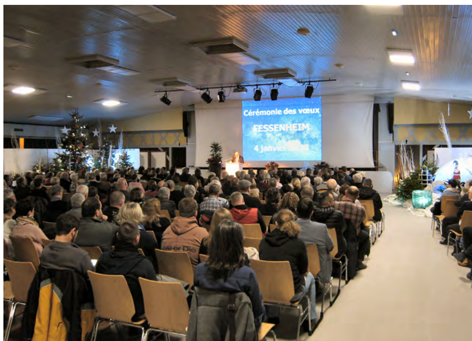
Public, personnalités et officiels étaient nombreux lors de la réception des vœux.