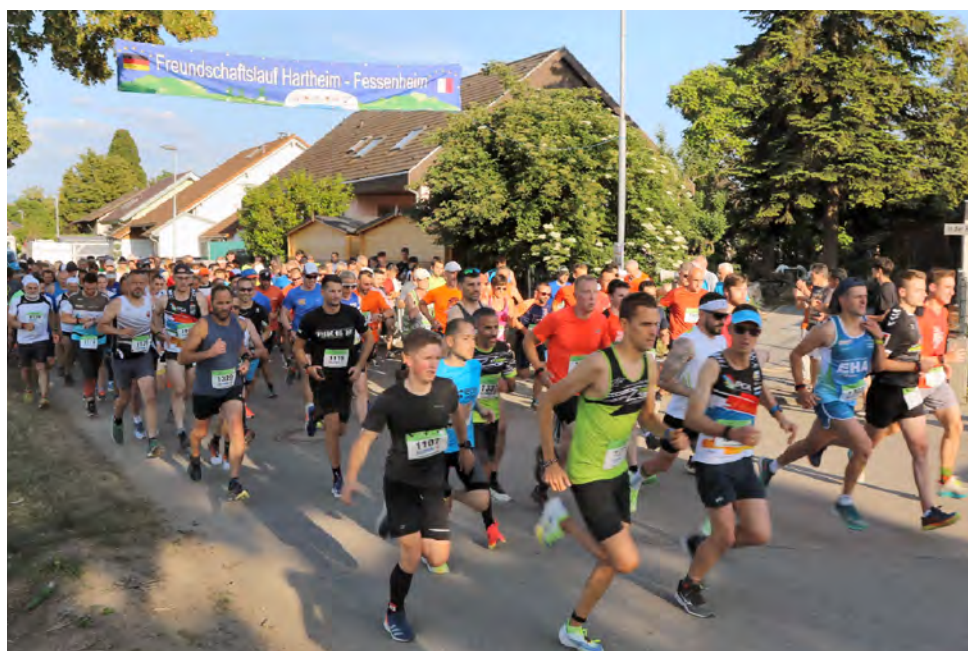
La course de l'amitié ouvre les festivités, vendredi 2 juin, au départ de Hartheim am Rhein.