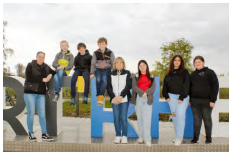
Le CMJ de Fessenheim sur le parvis d'Art'Rhena

Dans le cadre du projet citoyenneté piloté par le service sport et animation de la communauté de communes Alsace Rhin Brisach, les jeunes conseillers municipaux du territoire se sont retrouvés mi-avril à la salle culturelle Art'Rhena pour une journée d'échanges.