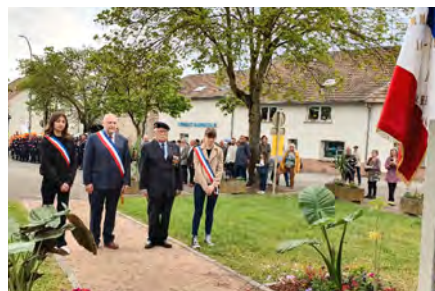
Commemoration du 8 mai 1945.