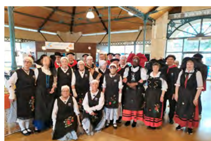
Fessenheimois et Mirandais se sont retrouvés lors du marché de l'Europe le 13 mai à Mirande.