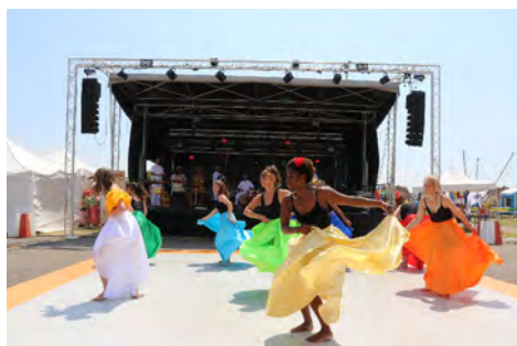
Les Cigognes des Caraïbes.