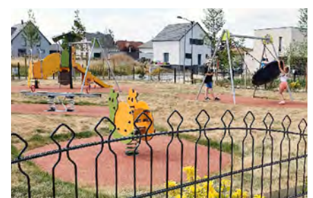
Une aire de jeux est désormais à disposition des enfants rue Victor Hugo.