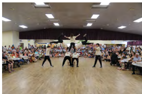
L'atelier break dance de l'association LAC.

Retrouvez les photos de la fête sur fessenheim.fr .