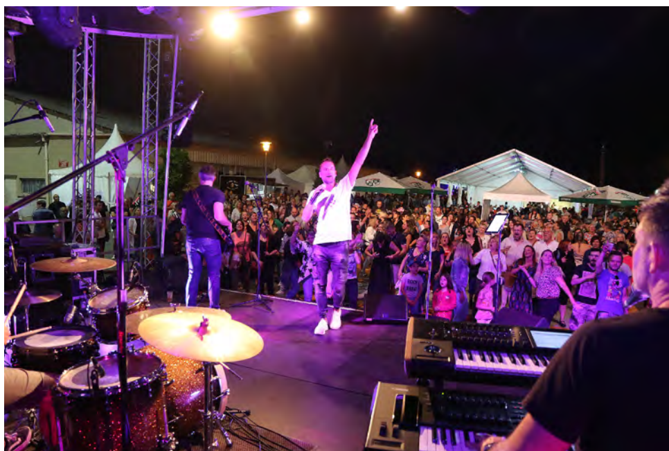
Le groupe Dr Boost attire toujours la foule