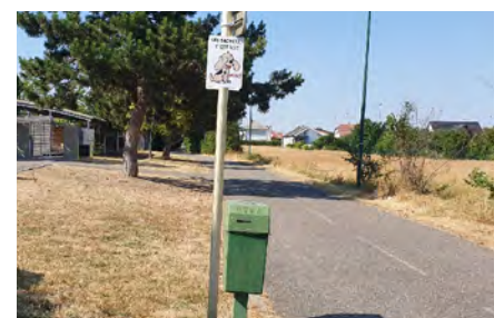
Panonceaux réalisés lors de la journée citoyenne.