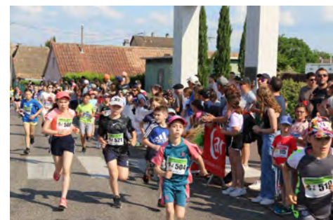
La course des Loupiots.