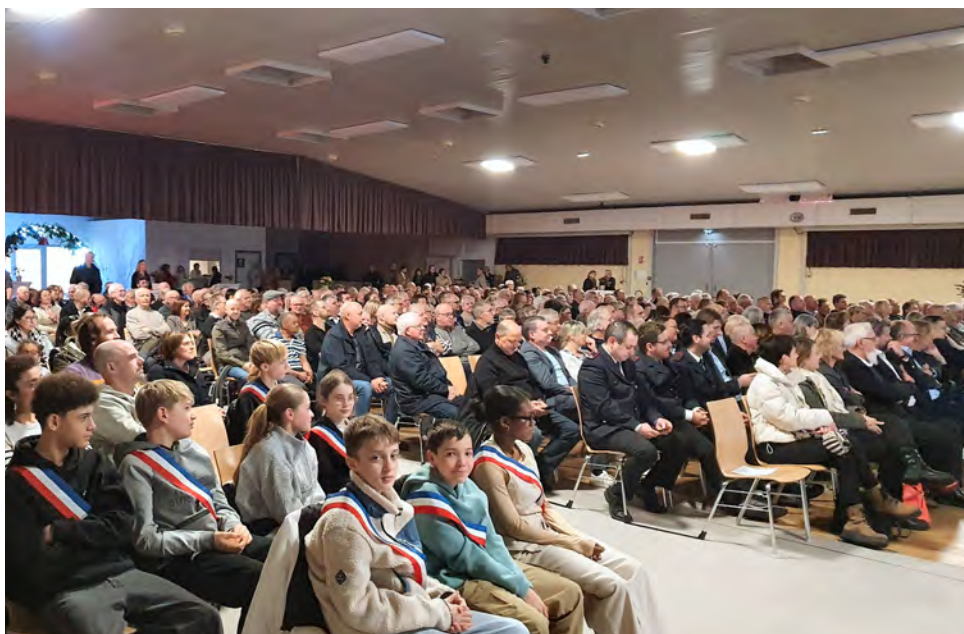
La cérémonie 2026 des vœux du maire à la population a attiré la foule.