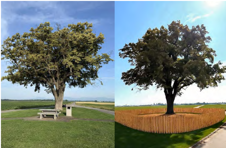
La surface nécessaire à sa survie va être rendue au tilleul du Zweibaümlweg.

Le grand tilleul situé sur le Zweibaümlweg était là avant nos arrière-grands-parents. Désormais fragilisé par le temps et l'attaque d'un champignon, sa vie peut être prolongée par une mesure simple, lui redonner de la place.