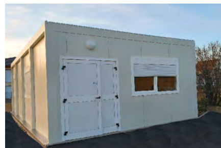
Un bâtiment modulaire accueille dorénavant les activités de l'atelier LAC Terre et céramique.