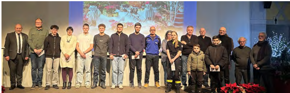
Les lauréats de la saison 2024/2025.

Cette année, la réception du Nouvel an a été l'occasion de mettre à l'honneur des personnes qui se sont particulièrement illustrées au cours de la saison passée.