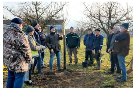
Une première formation à l'arboriculture s'est déroulée au verger, à côté de l'école Arc-en-ciel.