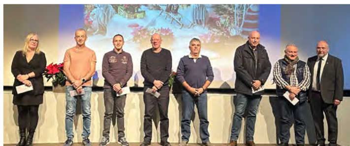
Les bénévoles récompensés pour leur implication dans la vie de leurs associations