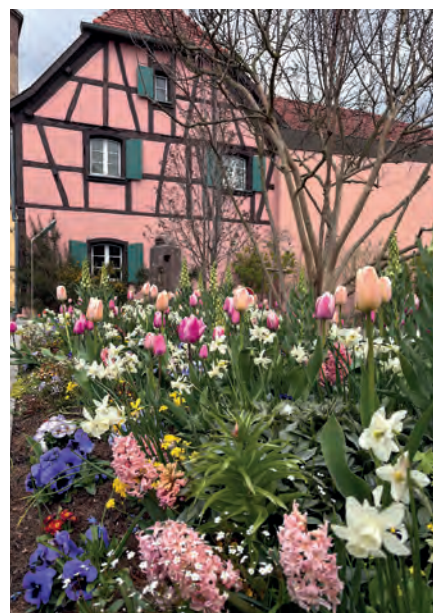
Composition printanière réalisée par les agents des espaces verts de la commune.